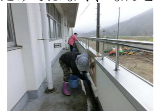
ベランダ掃除の様子→