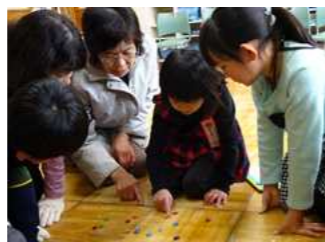
2年生昔の遊び体験

祖父母参観では、「昔の遊び体験」や「空気であらび作り」、「おじいさん、おばあさんに話を聴こう」などの活動をしました。そして5年生が中心となって作った『勇氣米』の餅つきを全校で行いました。今年は、きなこだけではなく、なんとあんこもちも登場しました。(5年生魁さんのおばあさんからの提供です。ありがとうございました。)また、今回、祖父母参観に合わせ、地域ボランティアの方にベランダ掃除をしていただきました。地域ボランティアの方を初め、準備に当たっていただいた環境委員のみなさん、お家の方々感謝、感謝です。ありがとうございました。